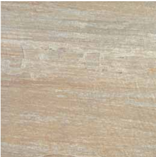
GOLD STONE 60x60 cm