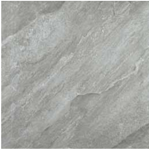
SILVER STONE 60x60 cm