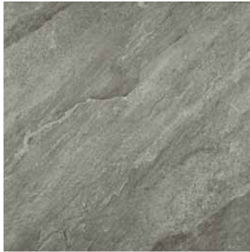
BLACK STONE 60x60 cm