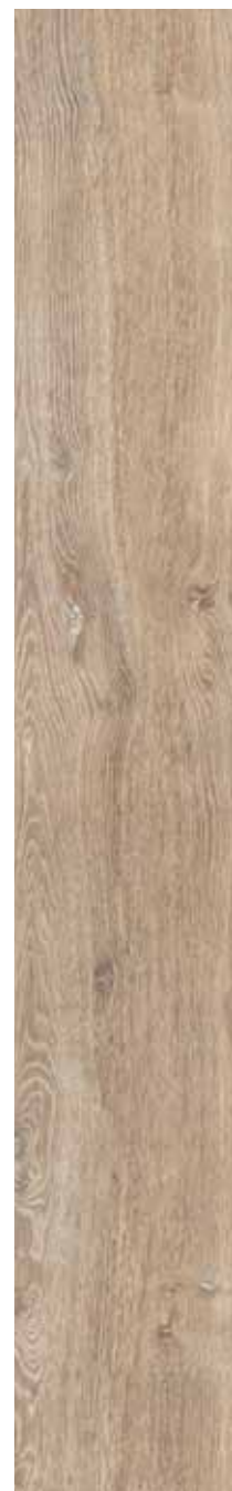
OB 1 Rett. 26,5x180 cm 10 3 / 8 x71 in 146