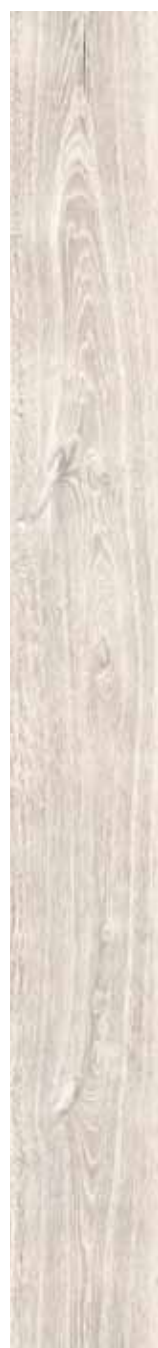
OB 10 Rett. 20x180 cm 8x71 in 146