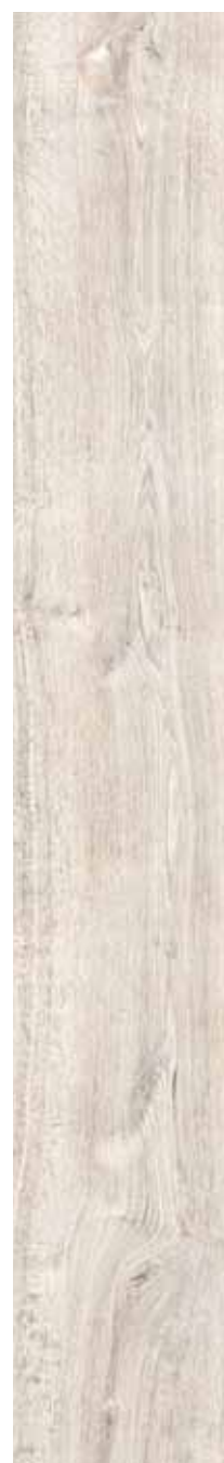
OB 10 Rett. 26,5x180 cm 10 3 / 8 x71 in 146