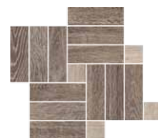
Mosaico / OB 3 41x35 cm 16 1 / 8 x13 6 / 8 in 293