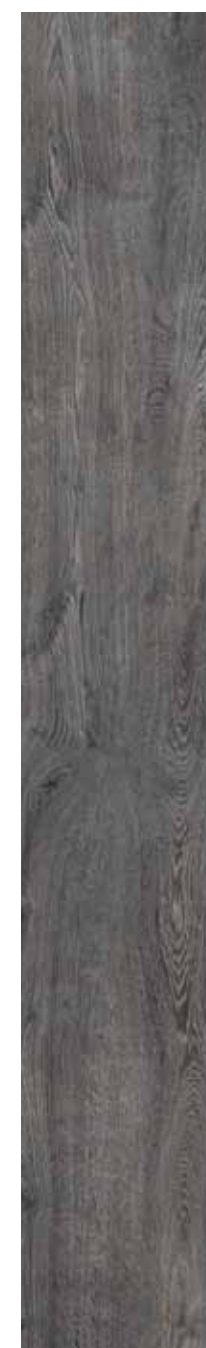
OB 8 Rett. 26,5x180 cm 10 3 / 8 x71 in 146