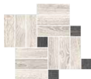
Mosaico / OB 10 41x35 cm 16 1 / 8 x13 6 / 8 in 293