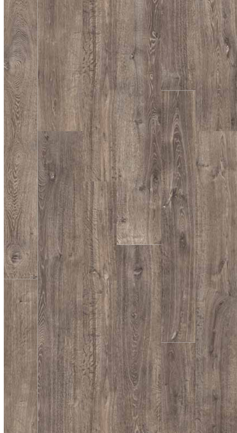
OB 3 Rett.