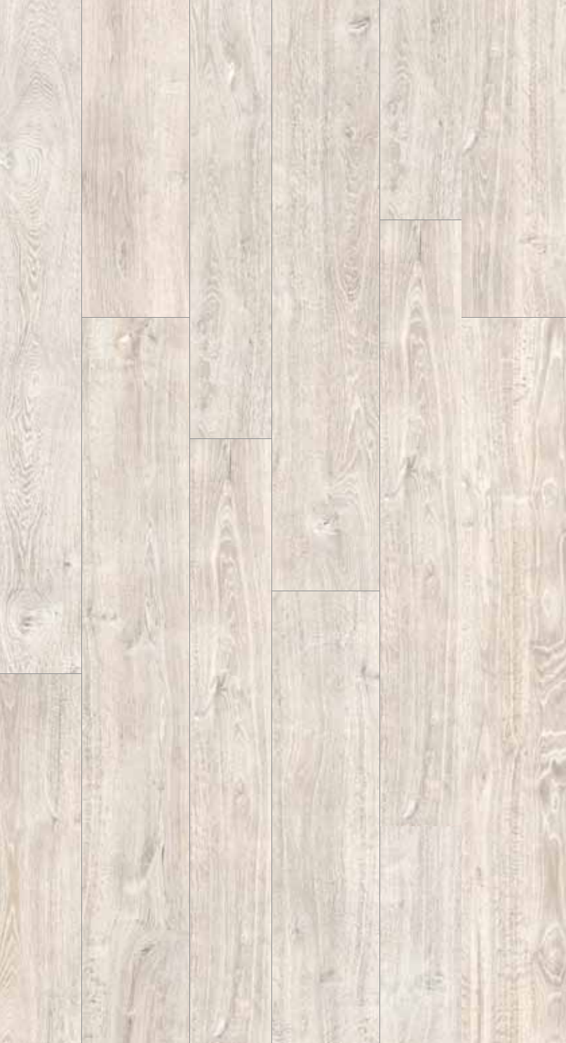
OB 10 Rett.