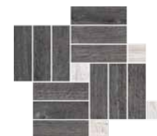
Mosaico / OB 8 41x35 cm 16 1 / 8 x13 6 / 8 in 293