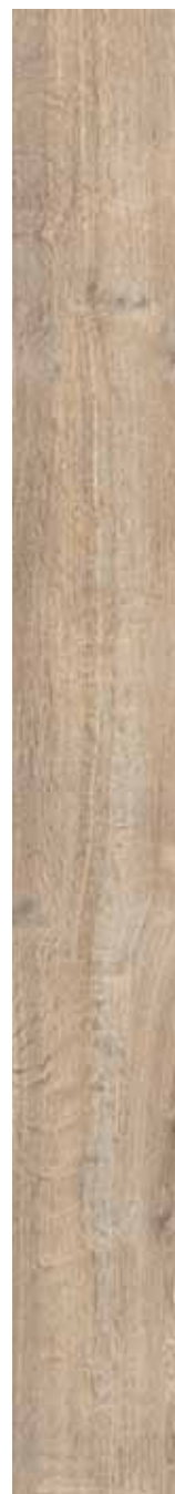
OB 1 Rett. 20x180 cm 8x71 in 146