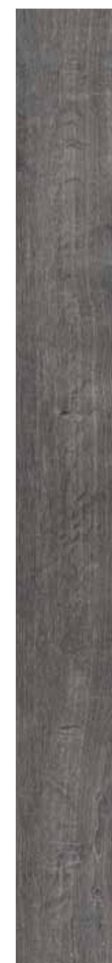
OB 8 Rett. 20x180 cm 8x71 in 146