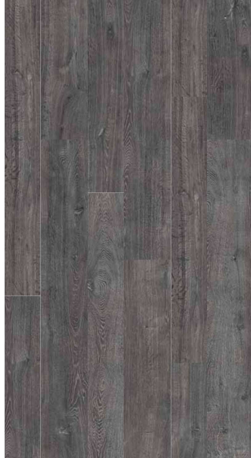
OB 8 Rett.