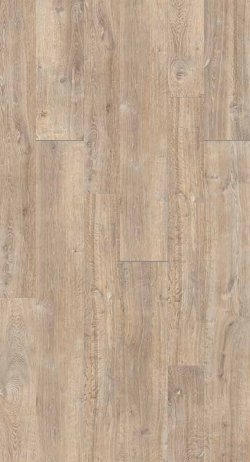
OB 1 Rett.