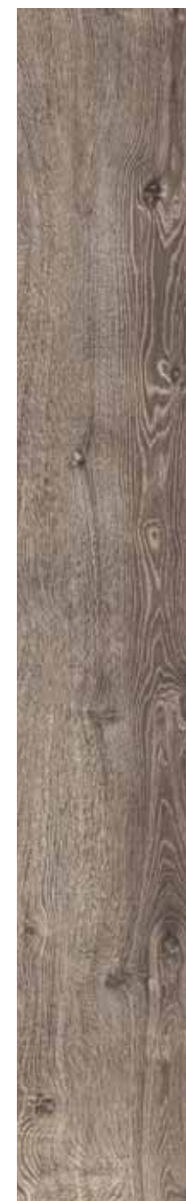
OB 3 Rett. 26,5x180 cm 10 3 / 8 x71 in 146