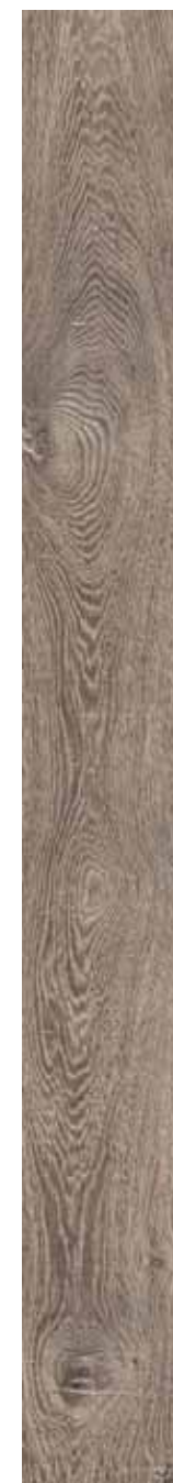
OB 3 Rett. 20x180 cm 8x71 in 146