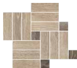
Mosaico / OB 1 41x35 cm 16 1 / 8 x13 6 / 8 in 293